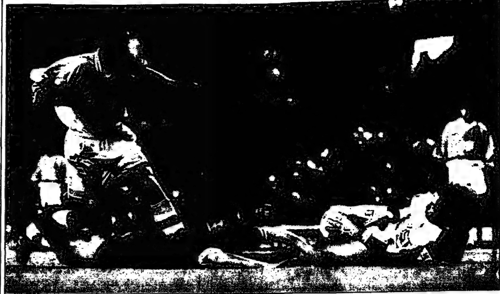
ميكيل جون ليفربول (الثاني من اليسار) سدد كروا خلال مباراة كينغفوت في مرمى فيلا (ديويت)

لندن - رويترز - احتفل ليفربول بفوزهم على استون فيلا في المباراة الأولى من الدوري الممتاز لكرة القدم في موسم 1997-98. وكان ليفربول قد فاز في المباراة الأولى من الدوري الممتاز لكرة القدم في موسم 1997-98. وكان ليفربول قد فاز في المباراة الأولى من الدوري الممتاز لكرة القدم في موسم 1997-98.